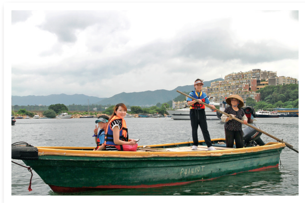
▲安排探訪水上人家的親子活動，讓學生親身體驗書中人物搖櫓的感受。

型的閱讀活動，如夜探螢火蟲讀書會、夜宿圖書館、家長讀書會等。這些閱讀活動更與跨課程閱讀主題緊密連繫，豐富學生閱讀經歷之餘，更深化對相關主題的認識。例如親子讀書會配合四年級其中一個單元舉辦「水上人家」活動，學生實地了解大埔三門仔水上人的生活方式、謀生技能及習俗等，並與漁民進行訪談，進一步認識本港漁業的今昔、漁民生活的變化。學生能在真實情境中，深化閱讀所得，體會水上人堅毅的精神，從而一起探討如何把這種獨特的漁村文化繼續保存及延續下去。