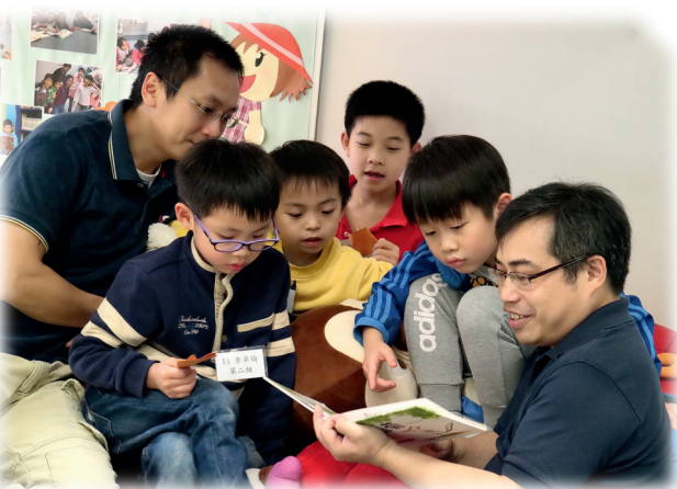
▲「寶湖親子讀書會」的夜宿圖書館閱讀活動

對於今次獲獎，兩位教師感謝評審團的肯定，楊老師表示：「設計24個跨課程閱讀單元，有效提升學生的自主能力、投入閱讀。我們很願意與同業分享，並一起為學生做得更多，讓他們懂得閱讀、喜愛閱讀，最終達至教學相長。」江老師也指出：「在閱讀教學上，我們仍在摸着石頭過河，期望透過分享，共同研究閱讀教學的策略，感染學生自主學習、培養正確價值觀，領略『悅』讀的真諦。」