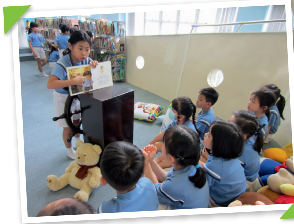
▲學生以講故事形式，分享書中內容，其他同學用心聆聽。