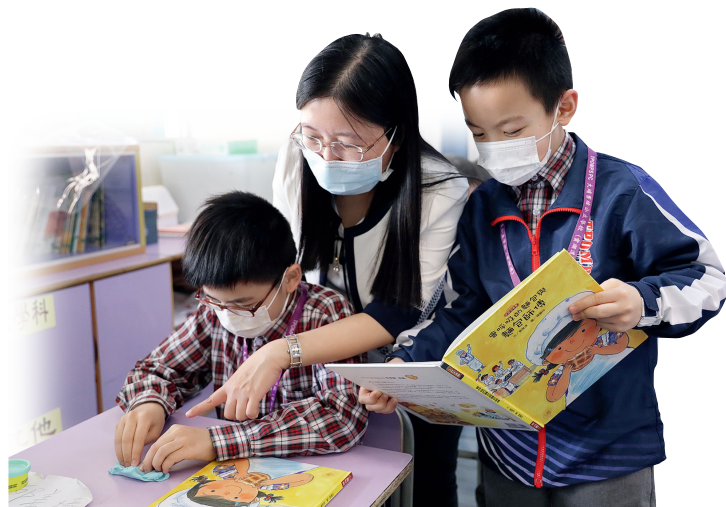
▲學生按照同學所說，動手體驗書中麪包師傅搓麪糰的動作。

本校的「寶湖親子讀書會」，為學生提供非一般的閱讀體驗，促進親子閱讀和互動，更有助跨課程閱讀的發展。透過體驗與閱讀的結合，豐富學生的生活經歷，拓寬閱讀視野，從而激發他們的閱讀動機及提升閱讀能力。我們與家長共同規劃不同類