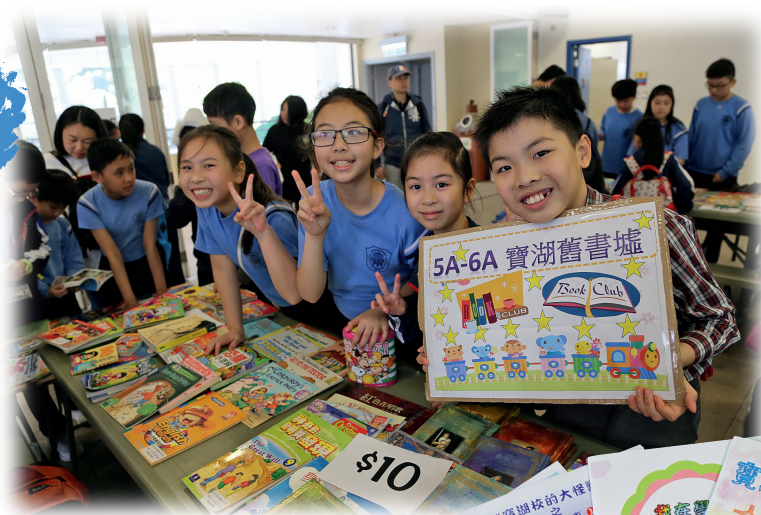
◀學生積極參與寶湖舊書墟活動