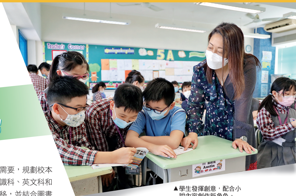
▲學生發揮創意，配合小說內容創作新角色。

觀課所見，課堂均配合常識科的課題和學習內容，運用創設情境、問答遊戲、比較閱讀、小組討論及匯報等學與教策略，引導學生學習。課堂學習目標清晰，規劃完整，組織嚴密，環環相扣，又能體現跨學科閱讀的優勢。學生學習能力頗高，預習認真，反應積極正面，投入活動，展示出良好的學習態度。教師善於架設鷹架，運用多元化學與教策略，逐步引導學生學習及完成任務。