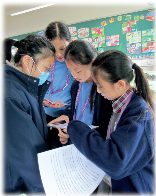
▲學生分享預習所得