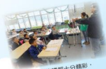
你們的講解十分精彩，我們實在獲益良多