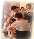
原來操作一輛輪椅真不是一件易事