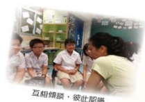
互相傾談，彼此認識