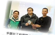
多謝社工和視障人士的分享，讓我們更瞭解視障人士的生活現況