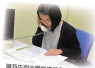
讓我們先向志願機構負責人聯絡，講解服務的目的。