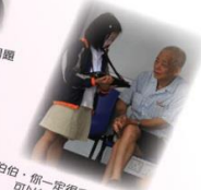
伯伯，你一定很了解這個社區， 可以用發我的訪問嗎？