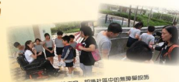
實地考察，認識社區中的無障礙設施