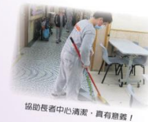
協助長者中心清潔，真有意義！