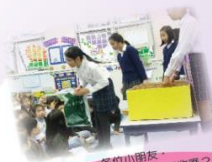
各位小朋友，你知道如何進行廢物回收嗎？