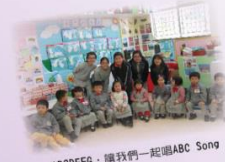
ABCDEFG - 讓我們一起唱ABC Song