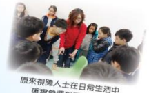
原來視障人士在日常生活確實會遇到不少困難