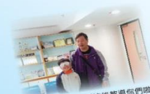
專教學導盲人類路法後教導你們嘍！