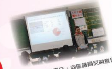
讓我們公民責任，向區議員反映意見