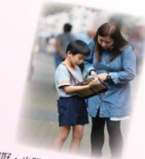
你好，小姐，我想問你幾多問題