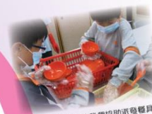
開眼眼！讓我們協助派發餐具