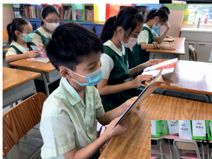
▲學生專注閱讀數學圖書

生都要將一個三角形的記號貼在手上，並用直尺量度各人手上大小不同和特徵各異的三角形，比較它們的邊長和特徵，從而尋找與自己手上三角形相似的「族人」，返回自己的「領土」。過程中，學生會錯誤地進入「異族」的「領土」，經教師點撥後，都能返回自己所屬的「領土」，反映學生確切掌握按三角形的特徵將它們分類。學生動手進行課堂活動，相比起工作紙上的練習題，來得更有趣味。令兩位教師最自豪的是，學生可以運用連串數學語言，清楚地說出三角形之間的關係。學生學得開心，教師也樂見其成。