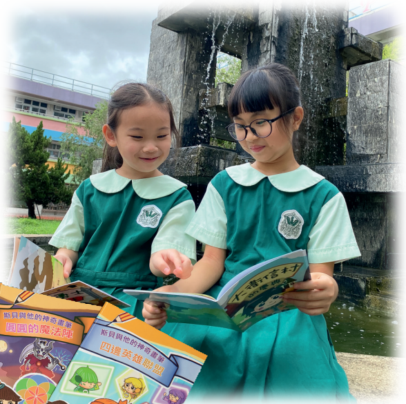
▲課堂外的繪本閱讀