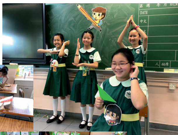
▲學生一同認識三角形的特徵。