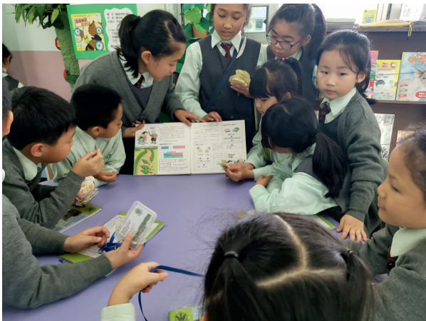
▲高年級學姐跟學弟妹講故事，講解數學原理。

兩位教師回顧八年來開發校本課程的心路歷程，跟其創作的數學繪本同樣充滿戲劇性，一切由「誤打誤撞」開始。張老師憶述，有一次向小四學生教授倍數時，發現他們對倍數概念的掌握感到困難，於是忽發奇想，構思了一個兔子躲避豺狼追捕的遊戲。「我在白紙上畫出布滿數字的路徑，然後跟學生說明豺狼和兔子步行速度的差距，讓他們用倍數的概念思考和計算兩者何時相遇。學生很喜歡這個遊戲，大家熱烈討論兔子怎樣才能避過豺狼的追捕。」這次經歷讓兩