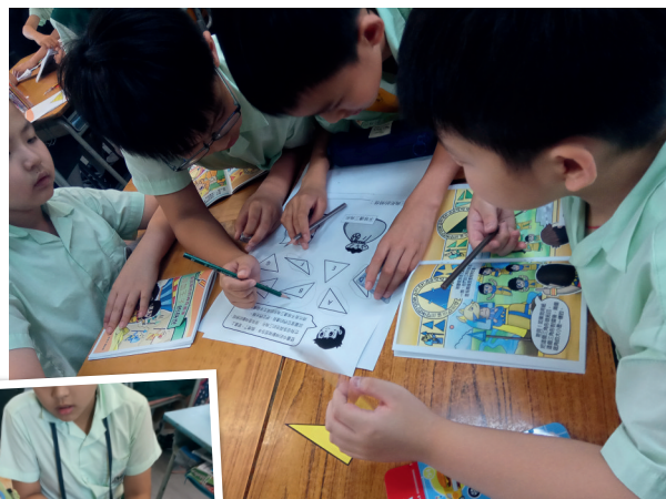
▲課堂的動手操作活動

我們認為課堂學習活動要多元化，學生通過多感官學習，既可加深學生記憶，也可照顧學習的多樣性。上數學課時，學生喜歡「表演」數學，配合教具，一邊進行角色扮演，一邊動手操作探究數學概念。例如在三年級「三角形」的課堂中，教師給予學生每人一個印記，以代表不同的三角形，學生需要按照自己身上三角形的特性，在課室內尋找「族人」。過程中，學生需要以工具檢測三角形的「邊」及「角」，然後與同學交流自己的想法。繪本教學能配合不同學習風格的學生，有些學生喜歡扮演主角，有些喜歡做觀察的角色，而每一位學生都有個人及小組學習的空間。最後他們都能成功尋回所有「族人」，和同學一起見證自己的學習成果和享受遊戲中學習帶來的滿足感。