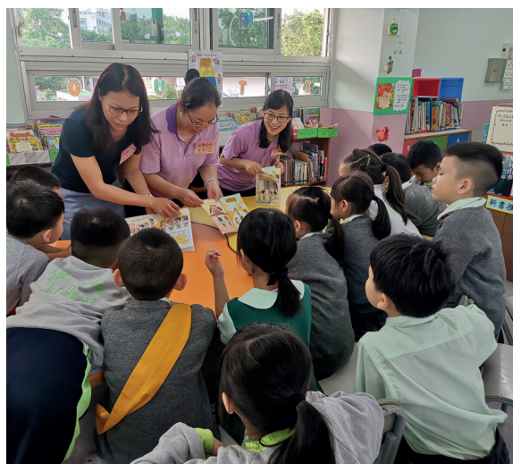
▲家長也認同繪本教學的理念，經常到學校跟學生講故事。

我們認為閱讀學習是全面性的，除了課內的閱讀活動，我們還會將數學圖書向家長推廣。我們會透過「家長學堂」對家長進行培訓，並在午息時間邀請家長到校為學生說數學故事。學生很喜歡聽故事，家長也很細心為學生準備了不同道具令故事更