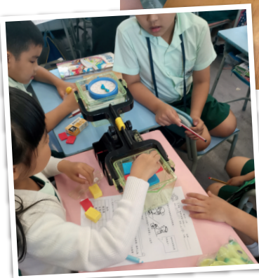
◀繪本教學課堂活動

具吸引力。活動令家長對我們學校的校本課程更加了解，也對我們數學教學增添一份肯定。