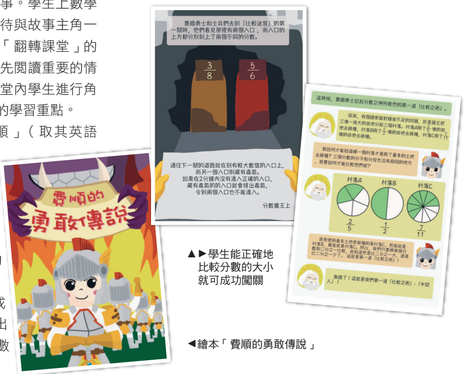
▲學生能正確地比較分數的大小就可成功闖關

繪本上一個接一個的闖關任務賦權學生運用數學知識解決一道一道的難題，比單一及機械式的練習題更能令學生投入。學生為協助主角解決危機，在不經不覺中增加了解題的機會，對學習內容亦會有更深的印象。最後，學生需對課堂作出反思，總結學習內容，進行自主學習。學生除了能內化知識外，往往能從中拓展高階思維。