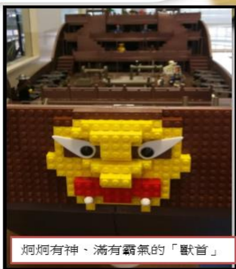
炯炯有神、滿有霸氣的「獸首」