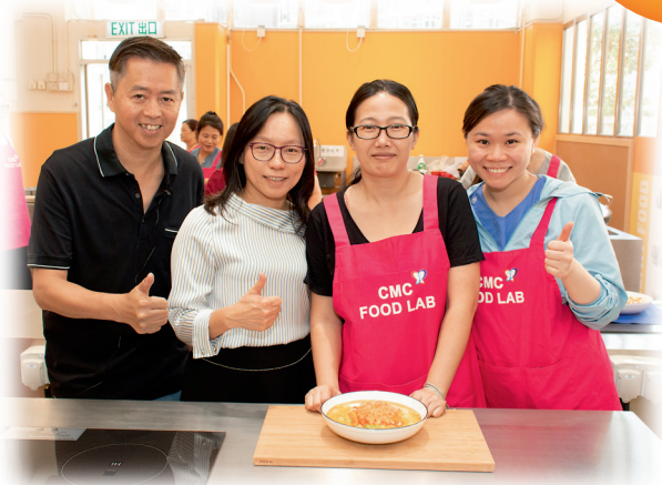
▲家校合作為學生製作美食

我們着重實證為本的評估，通過不同方式蒐集學生學習的表現，包括日常文字及錄像的教學記錄，與不同持份者訪談，例如：助教、治療師、家