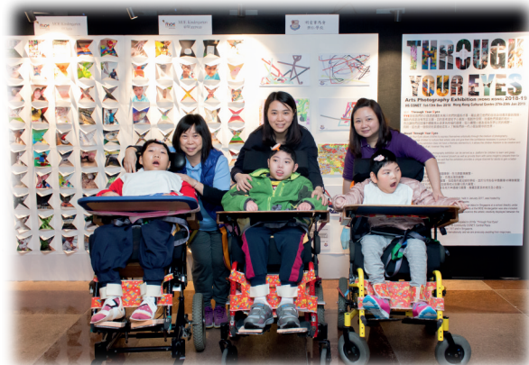
▲眼動儀視藝作品公開展覽，學生得到認同，提升自信。

我們相信使用眼動儀，能幫助學生減低因肢體障礙造成的限制，在「有限」中創造發展潛能的「無限」機會，提升學生學習自信心。我們期望通過實踐社群及教育研究，促進教師專業交流及自我完善，繼續推廣眼動儀在教育界的應用，與不同持份者協作、分享和創造知識，推動家長和公眾教育，建立共融社會。