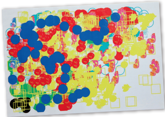
▲►學生的眼動儀視藝作品

感觸良多：「我初入職時曾教導一位學生，本以為她手肌能力薄弱，故上視藝課時一向執着她的手一同繪畫，後來無意中發現她能自己握着湯匙吃飯。當時心裏很自責，甚至認為自己不適合當老師，幸得其他同事鼓勵及不斷自我反思，我明白除了要用心教學外，也要準確評估學生能力，而不是以自己主觀的角度看待學生。我在此校已任教二十多年，面對不同的學生依然需要不斷學習，盡力摸索合適的教學法。縱使過程中曾遇挫折，也想過放棄，但只要看見學生微小的進步，已足以鼓勵我繼續向前。」