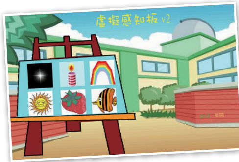
◀◀校本自製教學軟件

眼動儀雖然功能甚多，卻非所有學生合用。倘學生具備其他可替代能力，例如手肌能力良好，便不宜使用。即使學生經評估後能以眼動儀學習，也必須先具備基本視知覺能力。當學生能力未及，教師便會從實物開始訓練其注視及追視能力，讓他們學會聚焦注視身邊事物。直到視知覺能力表現穩定，才循序漸進地加入眼動儀的學習。為使學習過程更有系統，我們設計了進程架構（見圖表一），按學生能力細分學習步驟，讓教師規劃教學及評估安排，幫助學生從感官